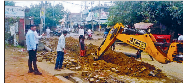
जींद। पेयजल सफाई की जांच करते हुए।