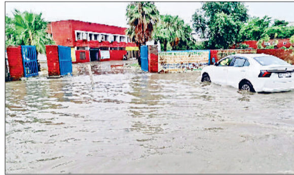
जींद। कृषि कार्यालय के सामने बरसाती पानी से लबालब सड़क।