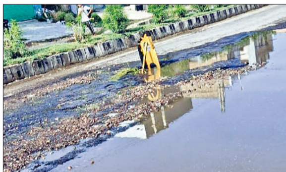
पुंडरी। कैथल मार्ग पर सड़क के बीचों-बीच लगा सांकेतिक चेतावनी बोर्ड।

कैथल मुख्य मार्ग पर बरसात ने प्रशासन की पोल खोल दी। सोमवार को हुई बरसात ने यह साबित कर दिया कि करोड़ों की लागत से बनाई गई सड़कें सिर्फ कागजों में मजबूत हैं। पानी निकासी की कोई समुचित व्यवस्था न होने के कारण सड़कें जगह-जगह से टूट गईं और सड़क पर जलभराव इतना बढ़ा हो गया कि गड्ढे पानी में छिप गए। स्थिति इतनी गंभीर हो गई कि दुर्घटनाओं की आशंका को देखते हुए स्थानीय दुकानदारों ने खुद सड़कें बंद करके सांकेतिक चेतावनी बोर्ड लगा दिए। ताकि राहगीरों और वाहन चालकों को दुर्घटना से बचाया जा सके। प्रशासन की नौदं में खलल डालने की ये कोशिश, उन अफसरों