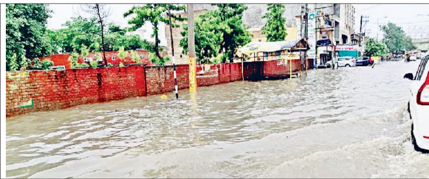
जींद। राजकीय विद्यालय के सामने बरसाती पानी से भरी सड़क।