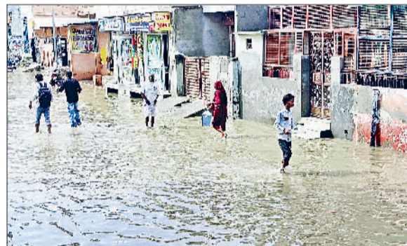
उचाना। बैंक कॉम्प्लेक्स रोड पर भरा बारिश का पानी।

राजौद। शहर के अरुंध रोड पर स्थित बस स्टैंड पर पानी निकासी न होने के कारण लोगों को भारी परेशानी उठानी पड़ रही है। आलम यह है कि बस स्टैंड के आगे पानी भरने से सवारों के साथ-साथ वाहन चालकों को भी बहुत परेशान होना पड़ रहा है। बस स्टैंड के पास पानी निकासी की कोई व्यवस्था नहीं है। जिससे थोड़ी सी बरसात होने पर बस स्टैंड भी पानी से लबालब भर जाता है। बिना बरसात के भी बस अड्डे के पास पानी खड़ा रहता है जिससे बस स्टैंड के अंदर जाने वाले लोगों के लिए बहुत ज्यादा परेशानी होती है।