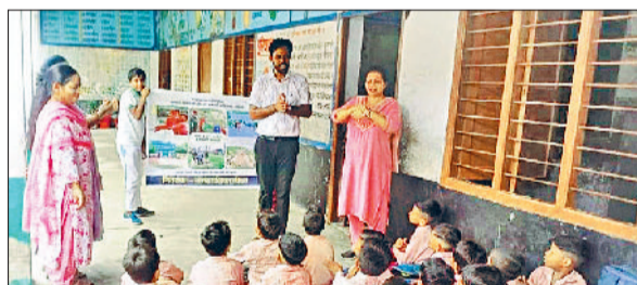
गुहला-चीका। विद्यार्थियों को जानकारी देते अधिकारी।