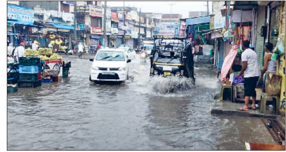
कैथल। छात्रावास रोड पर टाटे मारता बरसाती पानी।

बरसाती पानी में फंसे वाहन, करना पड़ा परेशानी का सामना बारिश के दौरान लबालब पानी से भरी सड़कों पर काफी संख्या में कार, दुपहिया वाहन फंस गए। लोगों को वाहनों को पानी में खिचते देखा गया। वहीं हालात सिटी रेलवे स्टेशन के निकट रेलवे अंडरपास के रहे। जिसमें छोटे वाहन फंस गए। दुपहिया वाहन चालकों को वापस लौटना पड़ा।