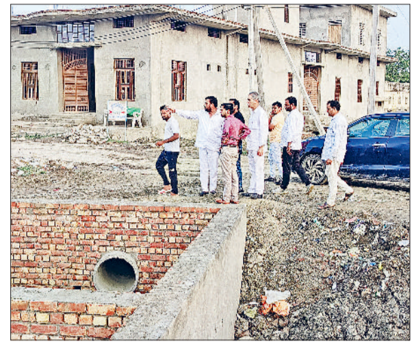
जुलाना। तालाब का निरीक्षण करते अधिकारी और चेयरमैन।

कुछ समय बाद तालाब में मिट्टी गिरनी शुरू हो जाएगी और तालाब फिर से अट जाएगा। लोगों ने आरोप लगाया कि इससे पहले भी जुलाना में एक तालाब की खुदाई कर तालाब के चारों ओर मिट्टी लगाई गई थी लेकिन कुछ माह बाद ही मिट्टी में दरारें आनी शुरू हो गईं और मिट्टी अब तालाब में गिर रही है। मिट्टी में बड़ी बड़ी दरारें आनी शुरू हो गई हैं। कस्बे के लोगों ने आरोप लगाया कि तालाब के सौंदर्यकरण के काम में काफी खामियां हैं लेकिन इस