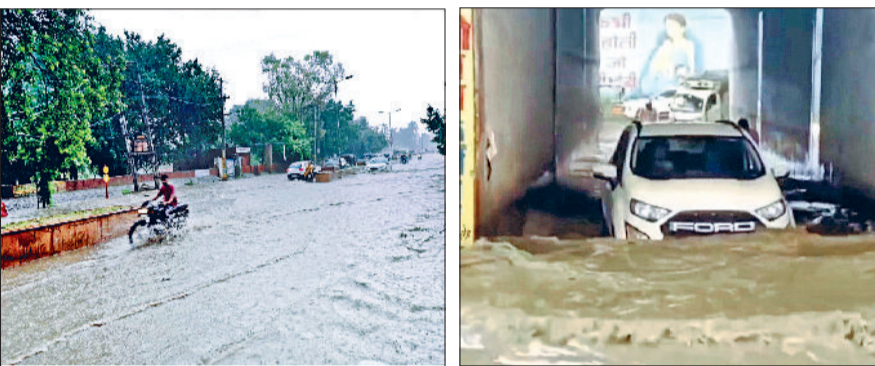
जींद। शहर की सड़कों पर जमा बरसाती पानी के बीच से गुजरते वाहन।