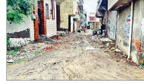
जीद। कीचड़ से सनी न्यू श्याम नगर कालोनी की गलियां।